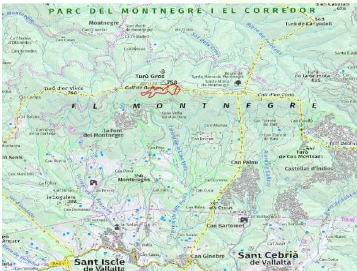
Figura 1. Situació del rodal GpNQhm (Casa Nova de Maspons).